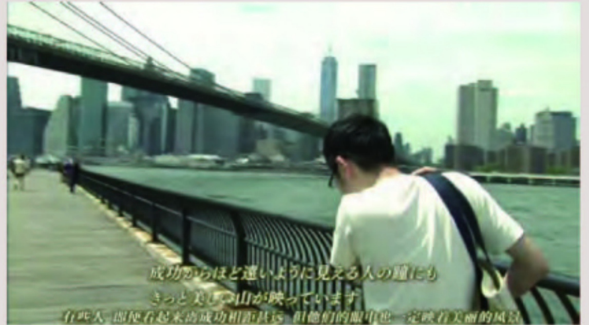
温柔的陌生人，愿你一生温暖纯良。 文 / 本报记者 何敬怡 杨雅云

爱不是过度泛滥的道德绑架，不是给予之后急不可耐地讨要成效，不是施舍，而是站在与之平等的平台，与之和善的对话，也许在遇见他们的时候，不再厌烦地一瞥，或者惊恐的躲避。而是正常地走过，正常地交流，或许有的时候可以自己当成是访问他们星球的访客，‘入乡随俗’，来一场独特的旅行。