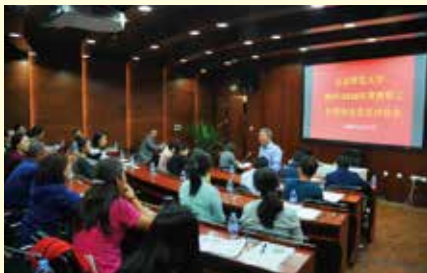
社团协会评优总结会