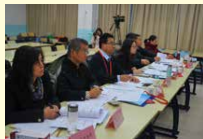
本科生教学理工科组评委认真评议