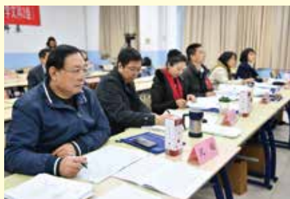
本科生教学文科2组评委认真评议