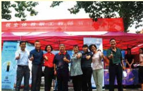
教师节服务教职工专项活动