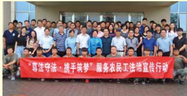
服务农民工法治宣传活动