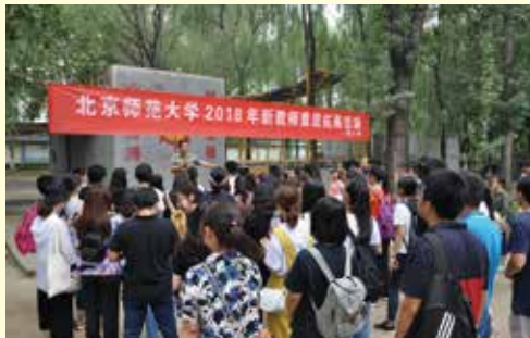
新教师素质拓展活动