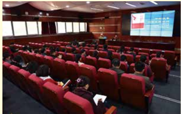
纪念改革开放四十周年 贯彻中国工会十七大精神系列报告会