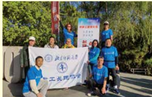
教职工健身长跑活动