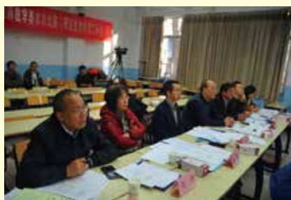
研究生教学理工科组评委认真评议