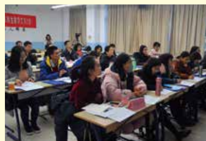
教师志愿者评委和学生志愿者评委认真评议