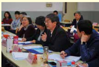
研究生教学文科组评委认真评议