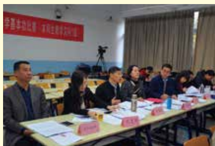
本科生教学文科1组评委认真评议